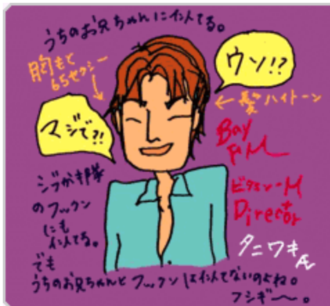
(illustrated by maaya.)

というわけでどうも他人のような気がしないんですが、今回はそんな谷脇さんから見た私というのをきいてみたいと思います。