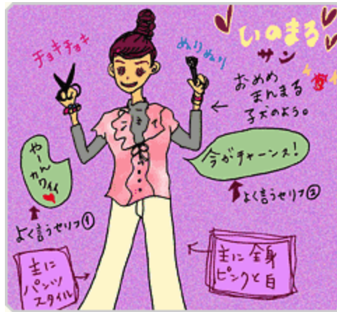
(illustrated by maaya.)